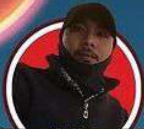
Wahyu Ari Sandi ST Videografer @arysandywahyu