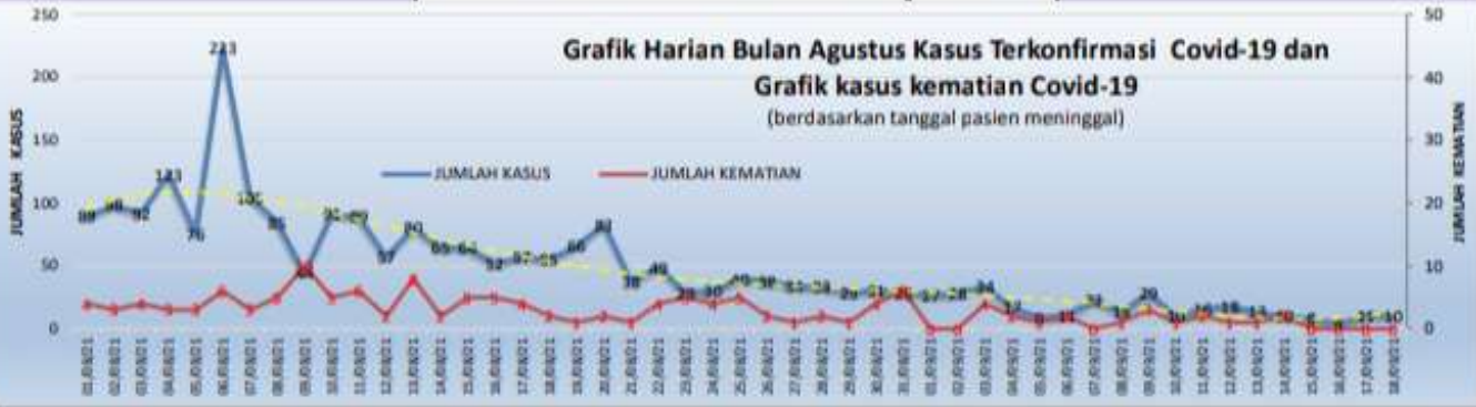
TREND GRAFIK MINGGUAN KASUS COVID-19 TAHUN 2021