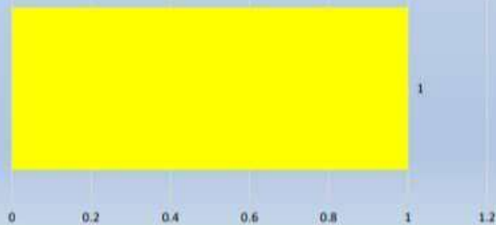
Kasus Terkonfirmasi Aktif sedang di rawat di Rumah Sakit Hari ini Tanggal 15 November 2021