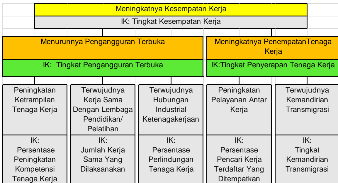
Gambar 2.1. Pohon Kinerja Dinas Tenaga Kerja dan Transmigrasi Kabupaten Bengkalis

Kinerja pelayanan Dinas Tenaga Kerja dan Transmigrasi Kabupaten Bengkalis memiliki tujuan meningkatkan kontribusi non migas terhadap perekonomian daerah dengan sasaran meningkatnya kesempatan kerja yang dijadikan sebagai Indikator Kinerja Utama Dinas Tenaga Kerja dan Transmigrasi Kabupaten Bengkalis. Gambaran kinerja pelayanan Dinas Tenaga Kerja dan Transmigrasi Kabupaten Bengkalis dapat dilihat pada pohon kinerja pada gambar 2.1.