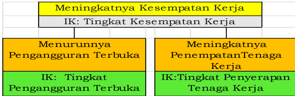
Gambar 2.2. Kerangka Berpikir Logis Pencapaian Tujuan Jangka Menengah Tahun 2023 Sasaran Strategis Meningkatkan Kesempatan Kerja

Menurut Badan Pusat Statistik pengangguran terbuka adalah orang yang tidak memiliki pekerjaan, sedang mencari pekerjaan, sedang mempersiapkan usaha atau belum mulai bekerja meskipun sudah memiliki pekerjaan. Sedangkan tingkat pengangguran terbuka adalah persentase jumlah pengangguran terhadap angkatan kerja. Faktor-faktor penyebab adanya pengangguran terbuka antara lain adalah jumlah penduduk yang tinggi dan peningkatan jumlah angkatan kerja, perubahan struktur ekonomi yang mengikuti perkembangan jaman dengan lebih mengandalkan peralatan canggih sehingga kebutuhan sumber daya manusia sebagai pekerja menurun, rendahnya tingkat pendidikan dan ketrampilan yang menjadikan calon pekerja sulit memperoleh pekerjaan serta penurunan tingkat perekonomian yang pada akhirnya akan menurunkan daya beli masyarakat atas sebuah produk sehingga mengurangi jumlah produksi. Selain daripada itu faktor kemalasan dan takut mengambil resiko dalam sebuah jenis pekerjaan juga menjadi faktor yang harus dipertimbangkan dalam menganalisa tingkat pengangguran terbuka yang ada pada sebuah daerah.