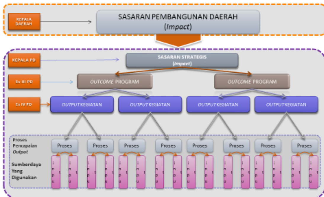
Gambar 6.1. Arsitektur Kinerja Pelaksanaan Tugas dan Fungsi Perangkat Daerah

Dari gambar di atas dapat dilihat bahwa pencapaian tujuan dan sasaran perangkat daerah menjadi tanggung jawab kepala perangkat daerah (eselon II). Sedangkan pencapaian outcome suatu program menjadi tanggung jawab kepala bidang/kepala bagian (eselon III). Sementara untuk pencapaian output kegiatan menjadi tanggung jawab kepala subbidang/kepala subbagian. Adapun staf pelaksana bertanggung jawab terhadap teknis pelaksanaan kegiatan (input dan proses).